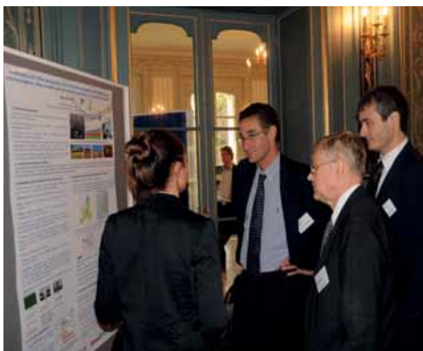
Workshop du fonds de recherche Enerbio à Vert-Mont (Fondation Tuck)

A lors que la Fondation est entièrement dédiée à des actions philanthropiques et reconnue comme telle par l'administration française, elle dépend des dons qui lui sont faits et ne dispose pas de dotation en capital. C'est uniquement grâce à de nombreux donateurs industriels, en France, en Europe et ailleurs, notamment des secteurs de l'énergie et des transports, que ses actions sont possibles et qu'elle est en mesure d'entretenir et de développer ce lieu magnifique, le Château de Vert-Mont , dont la vocation est d'encourager l'enseignement, la recherche et le dialogue scientifique.