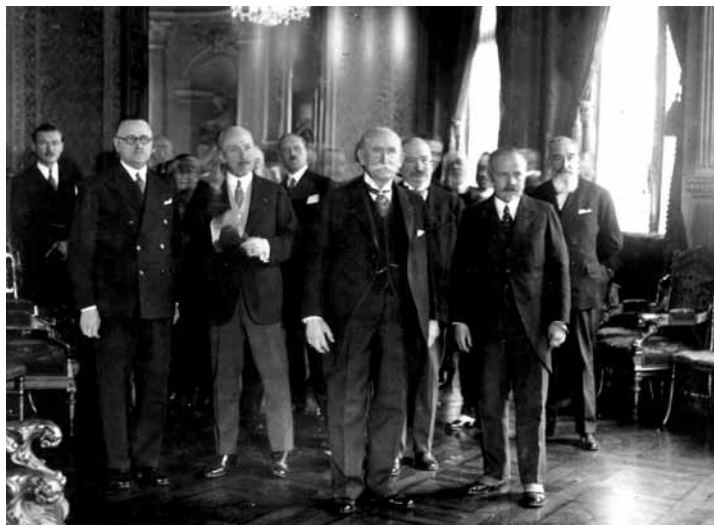
Edward Tuck (au centre) a été fait citoyen de Paris pour ses 90 ans (Fondation Tuck)

En effet, les Tuck vont se consacrer au mécénat en faveur d'un grand nombre de causes. Ils font notamment don d'une grande collection d'objets d'art au Petit Palais , à Paris, qui possède encore aujourd'hui une galerie Tuck . Ils font une donation encore plus importante à la ville de Rueil-Malmaison permettant la construction d'un hôpital avant la Première Guerre mondiale. Le rôle et les actions remarquables menées par Edward Tuck en France sont reconnus en 1929 lorsqu'il est élevé au grade de Dignité de grand'croix de la Légion d'honneur , une distinction accordée à moins de 3000 personnes depuis sa création en 1805.