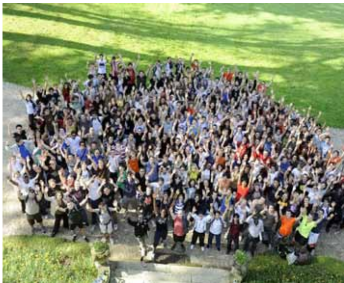
Les étudiants d'IFP School boursiers de la Fondation Tuck grâce aux mécènes industriels (IFP School)

M alheureusement, en dépit de nombreuses tentatives visant à mettre en place un tel centre, cet objectif ne peut pas être atteint et, en 1992, les administrateurs ressentent la nécessité de fixer de nouveaux objectifs pour le Château et le Domaine . Ils se rapprochent ainsi de l'IFP qui commence précisément à élargir et à internationaliser le recrutement de ses étudiants pour l' École du Pétrole . Ils s'entendent pour créer une fondation, qu'ils choisissent de nommer Fondation Tuck en l'honneur du donateur initial du domaine.